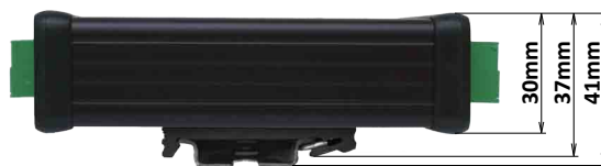
Pohľad z boku s pripevnenou DIN lištou